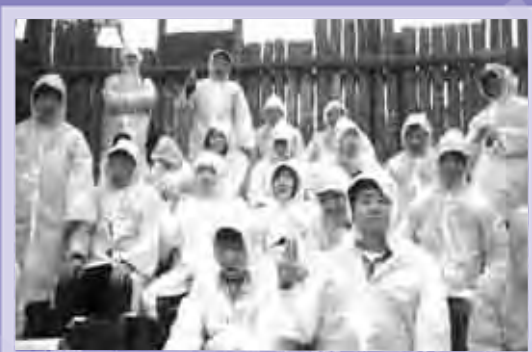
야외공연 관람 중 갑자기 소나기가!!~ 재빠르게 우비로 변신! 웃기죠??