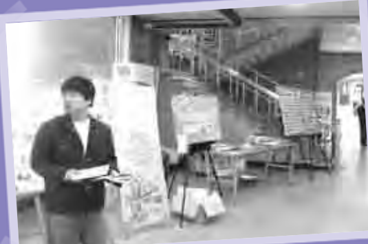
교회 로비에 설치한 굿월 부스 모습~