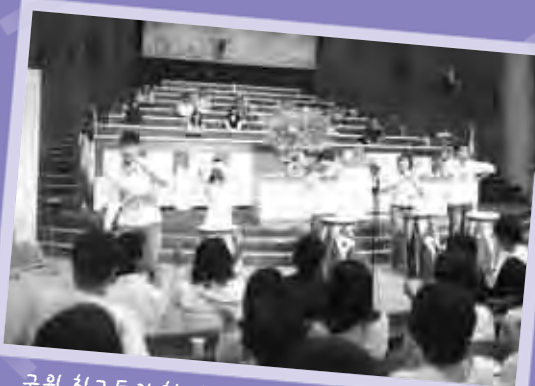
굿월 친구들의 첫 난타 공연! 성황리에 마쳤습니다.