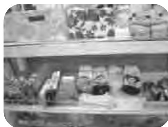
다양한 양말 (아동용, 성인용, 스타킹)