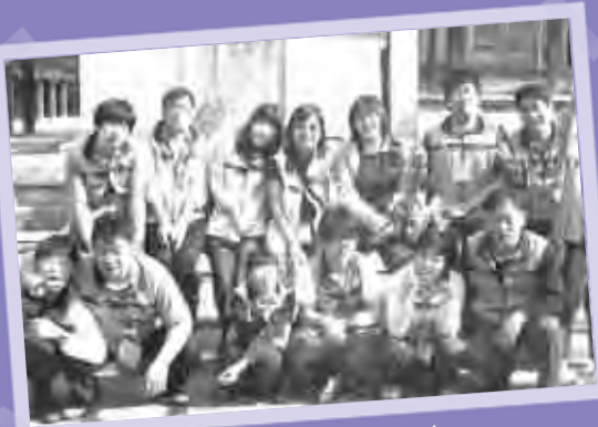
다보탑 앞에서 단체사진~