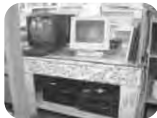
양증맞은 TV 모니터