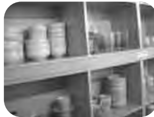
아기자기한 그릇 세트