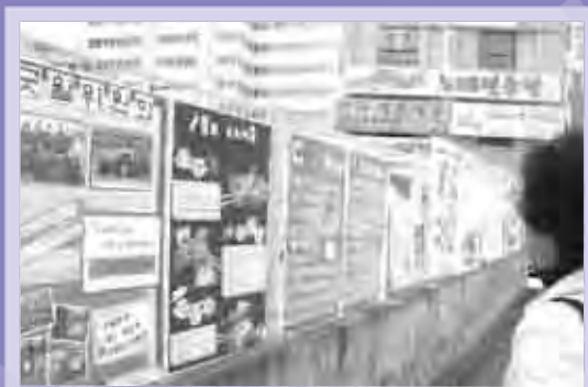
정성스레 만든 부스를 지나가던 분이 보고 계시네요.