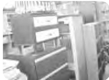
깨끗하고 세련된 가구