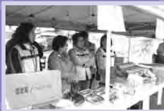
바자회 판매 행사 참가 중

4/22 중앙교회 바자회 5/17 외국인복지센터 다문화축제 5/23 장안구청 만석거축제 5/30~31 자원봉사센터 광고산축제