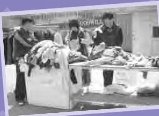
천원상품 판매중~ 인기 만점!!