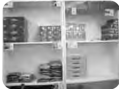
건강식품으로 활기찬 생활!