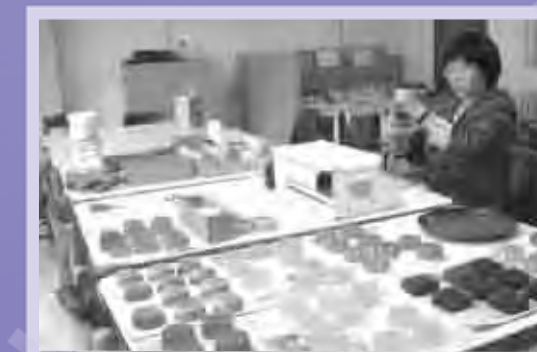
정성스럽게 천연비누 제조 중!