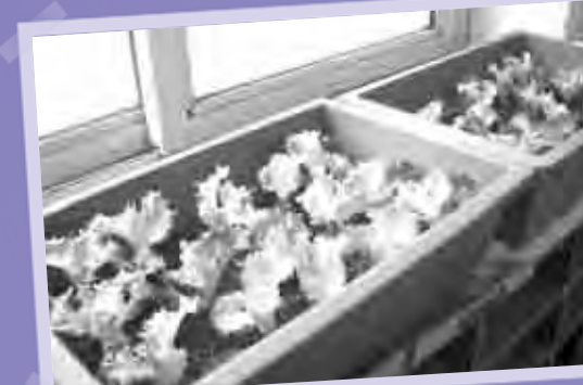
원예 가꾸기 프로그램~ 상추가 쑥쑥 잘 자라고 있네요~