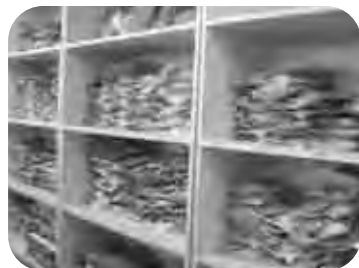
영양만점! 몸에 좋은 잡곡