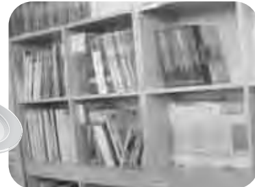
아동 전집 세트! 독서습관을 길러주세요.