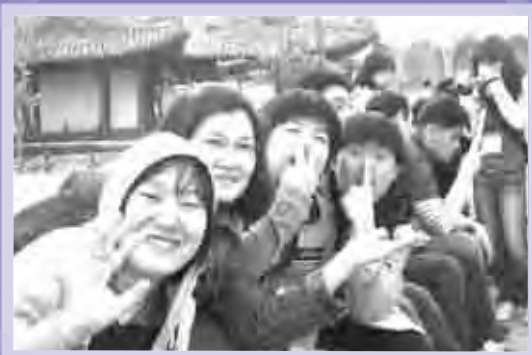
간만의 외출에 다들 너무 신났어요~