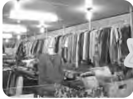
깨끗하게 세탁하여 진열합니다.