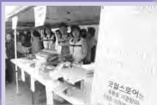
바쁜 와중에 잠시 한 컷!