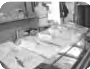
신사분들을 위한 다양한 셔츠