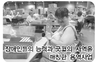
장애인들의 능력과 굿윌의 사역을 매칭한 용역사업