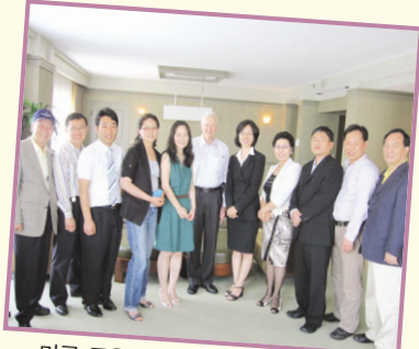
미국 굿윌인디애나지사 연수