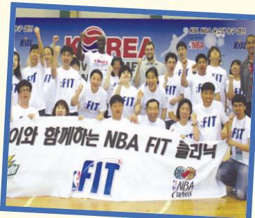
게토레이와 함께하는 NBA FIT