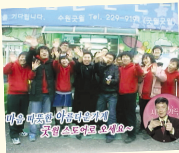
KBS 1TV 사랑의 가족에 굿윌 소개