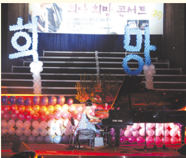
직업재활기금마련을 위한 희아 희망콘서트