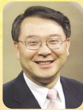
수원중앙침례교회 담임목사 수원중앙복지재단 대표이사