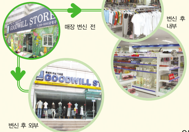
매장 변신 전