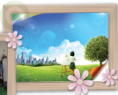
환경관리사 파견 정부용역계약 (전문용역종합관리업체)