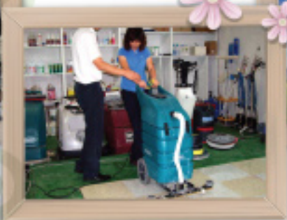
건물위생관리 이론 특수클리닝교육 (인력교육 및 양성)