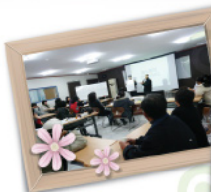
기초교육 비전 및 리더쉽교육 (기업연계)

Goodwill은 위생환경관리사 양성교육을 실시하여 청소업무에 자부심을 갖춘 전문가로 변화시키는데 최선을 다하고 있습니다. 고품질의 친환경청소를 이끌어냄으로서 고객의 만족도를 높일 수 있는 청소용역 전문기업으로 만들고 있습니다.