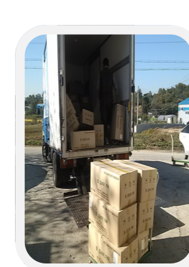
과자류 기증 (주)신나라

굿월자원봉사단은 우리 수원 굿월스토어의 자량입니다. 장애인과 취약계층의 사람들에게 일자리를 제공하여 개인의 자존감을 높여주고 인격을 회복시켜줌과 동시에 경제적인 자립을 지원함으로써 개인과 가정과 사회의 구성원으로서 당당한