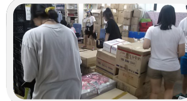
단국대 동아리 단체봉사